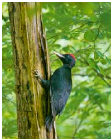
Unsere größte Spechart und unverwechselbar der Schwarzspecht

Schwarzspechte sind die Zimmermänner des Waldes und ihre Höhlen sind auch bei anderen Tieren als Lebensraum sehr begehrt.