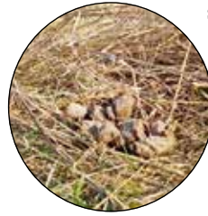
Eines von 300 „Osternestern“ auf der angelegten Magerwiese.

Gemäht wird ehrenamtlich von der Aktionsgemeinschaft. So ge-