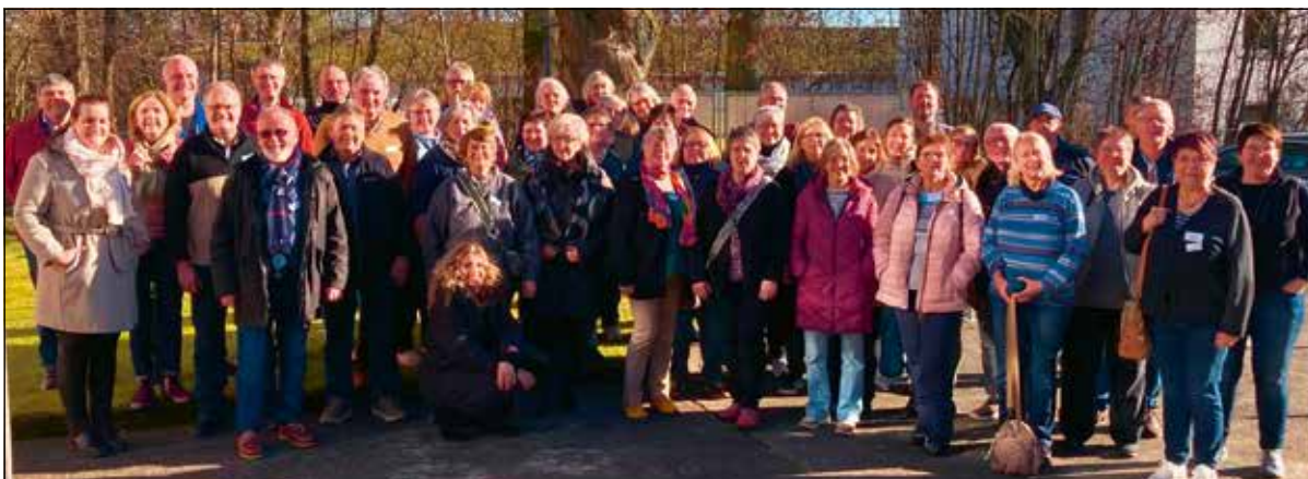
Die Teilnehmer des Workshops – fast der gesamte Chor

Vielleicht merkt man uns an, dass es einfach großen Spaß macht, mit so vielen zu singen. Das durften wir auch noch ein-