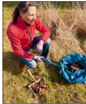
Danke an die Sammlerin der „Ostereier“