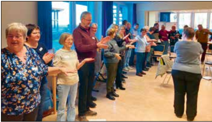
Probestunde beim Chorworkshop in Alsfeld

mal intensiv an unserem Chorworkshopwochenende in Alsfeld im Februar 2025 erleben. Die Zeit verging hier im Fluge. Samstagmorgen im Turn- und Leistungszentrum angekommen, ging es gleich mit der ersten Probeeinheit los, war doch der Samstag und auch noch der Sonntag bis zum frühen Nachmittag gut vollgepackt mit Übungsstunden.